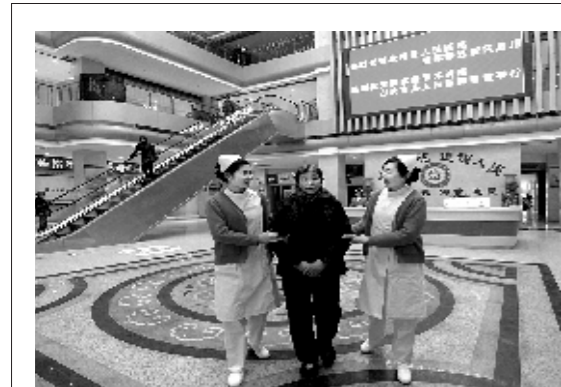
医务人员在新建成的医院门诊大厅内热情地为患者服务

贫帮困、义诊宣传、送医下乡、礼仪展示等,集中反映该院的精神风貌和改革开放带来的巨大变化。此次活动结束后,该院将邀请专家评奖。