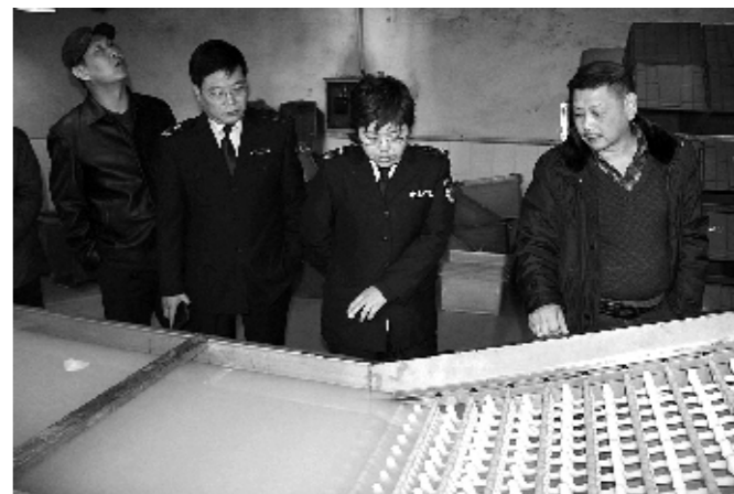
三门峡市卫生局近日组织卫生监督人员对4家餐饮服务集中消毒服务单位进行突击检查。检查内容包括生产环境、车间布局、工艺流程、消毒设施及卫生防护设施等。

首先,郑州大桥医院对下辖7个社区卫生服务中心采取模块化健康管理,该院先后成立检验中心、围产保健中心、计划免疫儿童保健健康管理中心等6个业务管理中心,各业务中心对郑州大桥医院及所属7个社区卫生服务中心的相关人员和业务实行统一管理,弥补了社区卫生服务中心专业人员不足、业务能力不强的缺陷,同时也增强了居民对社区卫生服务中心服务能力的信任度。其次,地理位置与主办医院最近的南阳新村社区卫生服务中心与该院的妇产科发展相辅相成。如今,郑州大桥医院妇产科年社会分娩量近1万人次。该院龙头科室发展起来了,该中心自然近水楼台先得月。尹明训说:“由于儿保门诊量较大,工作人员经常加班加点,我们将加大儿童保健的投入力度,增加服务内涵,进一步提升服务质量。”